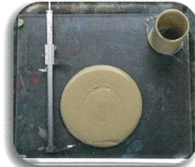
シリンダーフローコーン