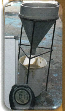
プレバクトフローコーン