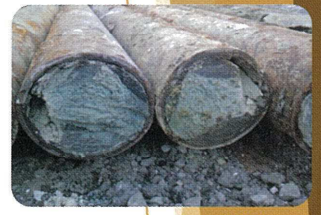
充填状況(施工実証)