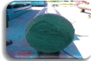
ノンブリーディング充填